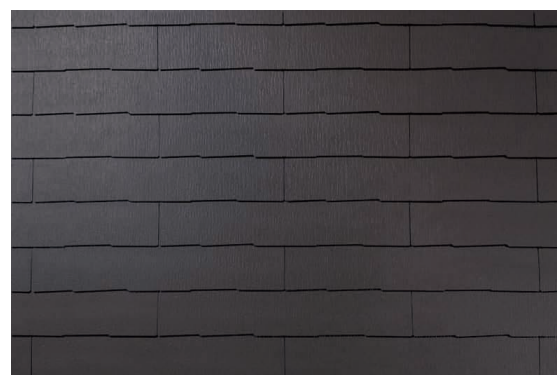
ココナッツ・ブラウン