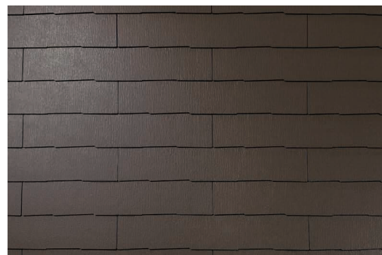
ウォルナット・ブラウン