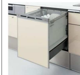
食器洗い乾燥機 深型 ドアパネル仕様 シルバー色 スリムデザイン 節電コース ソフト排気温 <QSS45VD7SD>