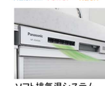
ソフト排気温システム お子さまの背丈に配慮して、排気温度を下げて排気。外気を混合するシステムで湿度も低く抑えます。