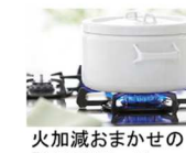
火加減おまかせの「便利機能」付