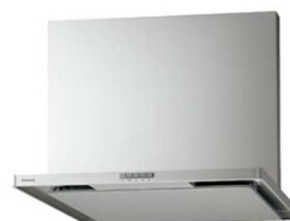
スマートフードⅡ W900mm 常時換気 シルバー色 LED照明 ＜QSS43AHZ3M＞