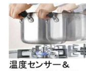
温度センサー&消し忘れ消火機能