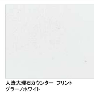
人造大理石カウンター フリント グレーノホワイト