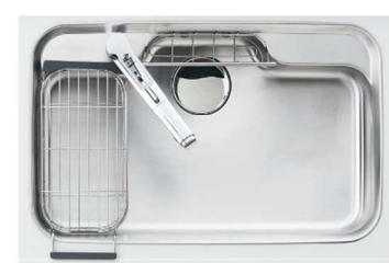
スキマレスシンク ステンレスタイプ Mタイプ スラくるネット付 端から端まで動かせる便利な「スラくるネット」。 幅787×奥行最大480/最小403×深さ195mm