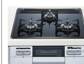
ガスコンロ ガラストップ W600mm 両面焼きグリル 【正面：シルバー色】 トップレート：ブラックドット ＜QSSW32Q6W＞