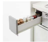
(シルバー/ブラック)