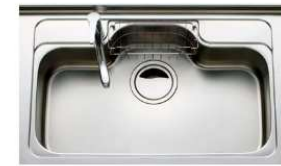
EGシンク ※シンク寸法、対応開口はステンレスシンク(TGシンク)と同様です。