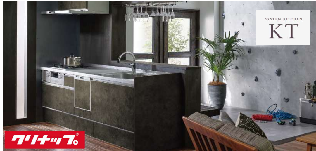
キッチンから、笑顔をつくろう