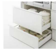
対応開口:750-1050mm ※点検口付も選択可能です。