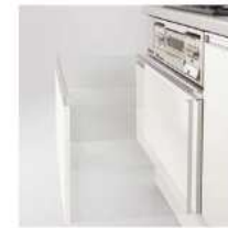
サイレントレール